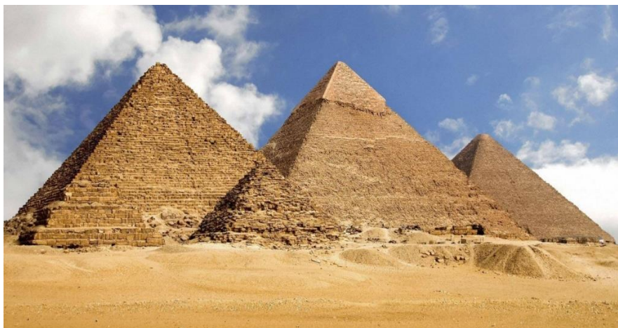
Após sua morte o faraó tinha o corpo colocado em pirâmides.

Abaixo do faraó e de sua família vinham as camadas privilegiadas como sacerdotes, nobres e funcionários. Na base da pirâmide social egípcia estavam os não privilegiados que eram artesãos, camponeses, escravos e soldados. Os sacerdotes formavam, junto com os nobres, a corte real. Tanto a nobreza como o sacerdócio eram hereditários compondo a elite militar e latifundiária.